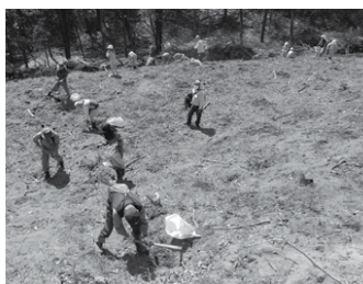
地区住民による植樹イベント。植林は未来をつくる。そして未来に責任を持つ行為でもある

苗木を植えるわけで、これを「坪植え」と呼ぶ。1坪は1間(約1.8メートル)四方だから、畳2枚分のスペースに1本植えるのだとイメージすればいい。だが、これはあくまでも一般的な手法で、質の高い木を育てる場合は植え付け本数を増やす。たくさん植えて質の劣ったものを間伐で少しずつ間引きし、粒よりの木だけに育て上げるわけだ。本数を増やして密度が高い状態で管理することによって肥大(太ること)成長を抑え、年輪の話まった木に仕立てる狙いもある。多少混んでいた方がまっすぐに育てやすいとも言われる。