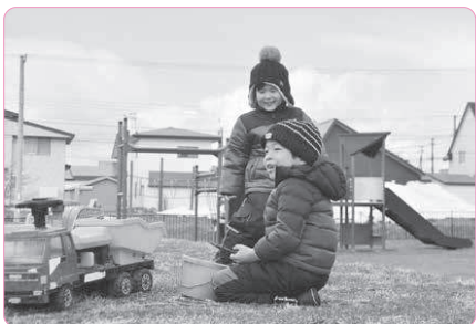
認定こども園の園庭で遊ぶ子どもたち=2022年4月、北海道厚沢部町

しかし、親にとっては働きやすい場所を選べることで、休暇の意味だけでなく、例えば親の介護や二拠点居住なども可能となり、子どもにとっても自然や