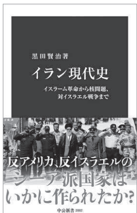
「イラン現代史 イスラム革命から核問題、対イスラエル戦争まで」黒田賢治 著 中公新書

ある。それは現体制に対して政治的に異なる立場の人々にある、唯一の共通性といっている。これまでの抗議運動で、運動側と体制側が衝突を繰り返し、同じイランという国に住みながらも、別世界に生きる住人のように分断されてきた。その分断はなおも根強い。しかし戦争という危機的状況のなかで、分断されてきた当事者同士が関わらざるを得ない状況も生まれている。なかには、これまで体制を批判してきたような若者が、体制派とともに路上に姿を現すことも見られるようになった。