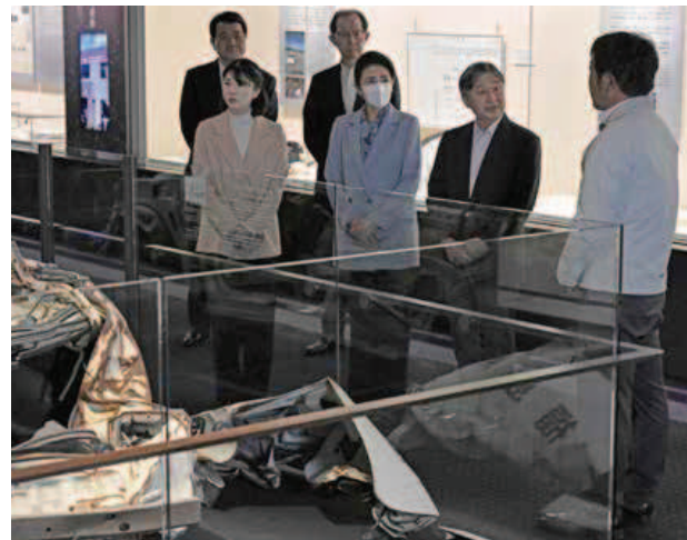
福島県富岡町の「とみおかアーカイブ・ミュージアム」を視察し、説明を受けられる天皇、皇后両陛下と愛子さま。手前は津波で損壊したハトカー＝4月7日