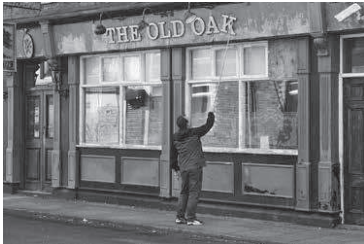
「オールド・オーク」4月24日(金)よりヒューマン・トラスト・シネマ・有楽町他全国ロードショー

新作「オールド・オーク」は、世界中で深刻化している移民受け入れ問題がテーマ。弱者を冷酷に切り捨てる社会に対する怒りをぶつけた「わ