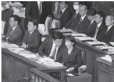
衆院本会議に臨む高市首相(手前)と木原官房長官=4月2日

だが、高市早苗首相の反応は鈍かった。1973年の第1次石油危機以来、ずっと積み上げてきた石油の国家備蓄は戦闘が始まる前の時点で248日分あった。それに寄り