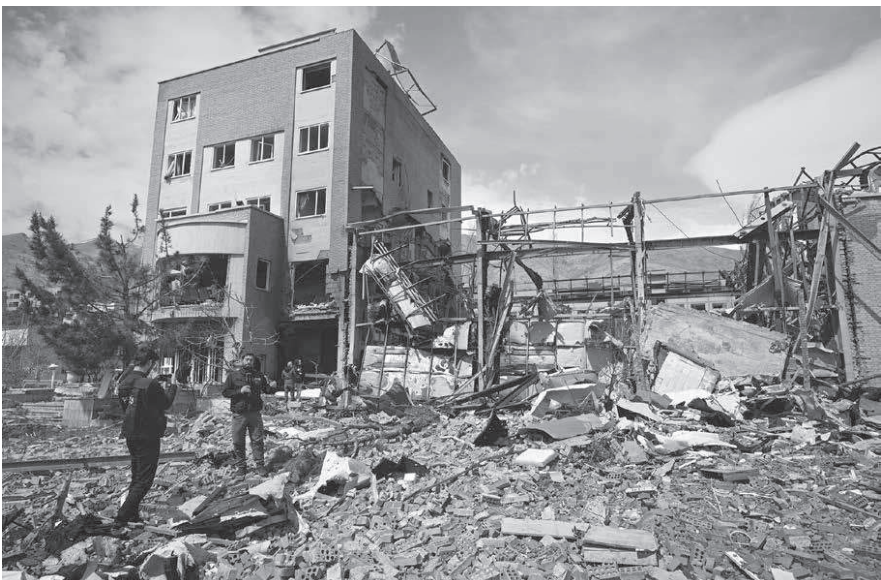
米イスラエルの攻撃を受け、損壊したシャヒド・ベヘシュティ大学の研究施設=4月4日、テヘラン