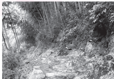
湖南省の山林＝2023年10月、筆者撮影（番組とは関係ありません）

AI時代の中国で 生きる美感を求める若者たち あなたが知っている動画や文章を作っているのは人間ですか？中国では、AIが生成したアニメや漫画が急増している。AI生成アニメは月間4千本以上が量産され、制作費はこれまでの数分の一。ただ内容はフォーマット化されており既視感のあるものが多く、安く手軽に楽しめるインスタント食品のような娯楽が増えている感覚に近い。 一方で、泥と汗のおいがあるような番組も人気になっている。湖南省張家界で行われている「極限荒野求生チャレンジ」は100人の参加者が最低限の道具だけを持って山に入り、どれだけ長く、生き残れるかを競う様子が放映されている。選手が雨風の中で火を起こすほか、わずかな木の実を探して飢えをしのぐ姿がSNSで広まり、関連動画の再生回数は100億回を超えた。火を起こせず、木の実と