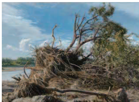
小尾修 「咆哮」 2021年

会場: ホキ美術館 千葉県緑区あすみが丘東3-15 会期: ～2026年5月13日 開館時間: 午前10時～午後5時30分 12月29日は午後4時30分閉館 (入場は閉館の30分前まで) 休館日: 火曜日(5月5日は開館)、12月31日、 2026年1月1日、5月7日 料金: 一般 2100円 65歳以上・高年生 1600円 中学生 1000円 小学生以下 800円 (小学生以下は保護者1人につき2人まで無料)