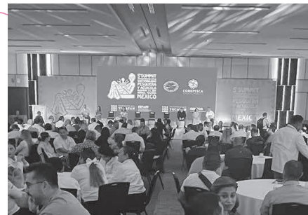
メリダの国際会議場にて=12月4日

際会議だ。漁業や養殖業の変革、持続可能な水産業の推進を目的に、2019年にスタートしており、5回目を迎えた今回の参加者は17カ国から600余人。ユカタン州知事をはじめ政府機関、研究機関、漁業団体、メディア、金融機関、流通事業者、市民団体、シェフなどさまざまなセクターからの登壇者は、中南米を中心に1500人を超え、水産業や水産物の影響が及ぶ社会範囲の幅広さを物語る。 社会的公正、トレーサビリティ（生産流通履歴、気候変動への適応をテーマに20を数えた、パネルセッションのタイトルは「水産市場におけるデジタル・トレーサビリティの実践」「持続可能な漁業に対する投資案件候補集」「気候危機とバリューチェーンの脱炭素化」「シェフが語る水産物の新たな可能性」などで、どれも非常に活発な議論