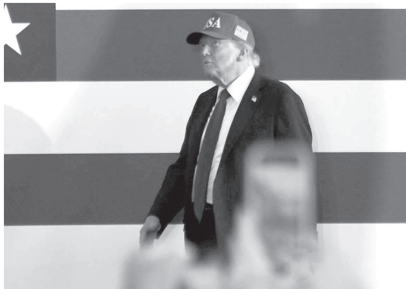
星条旗を背にして歩くトランプ米大統領=7月、アイオワ州デモイン

中間選挙は4年おきに行われる大統領選の折り返しで実施されるため、政権に対する途中評価の意味合いが強い。次回選挙の焦点は、ホワイトハウスと連邦議会上下院を握る共和党の「トライフエクタ」状態が維持されるかどうかだ。従来予想では共和党