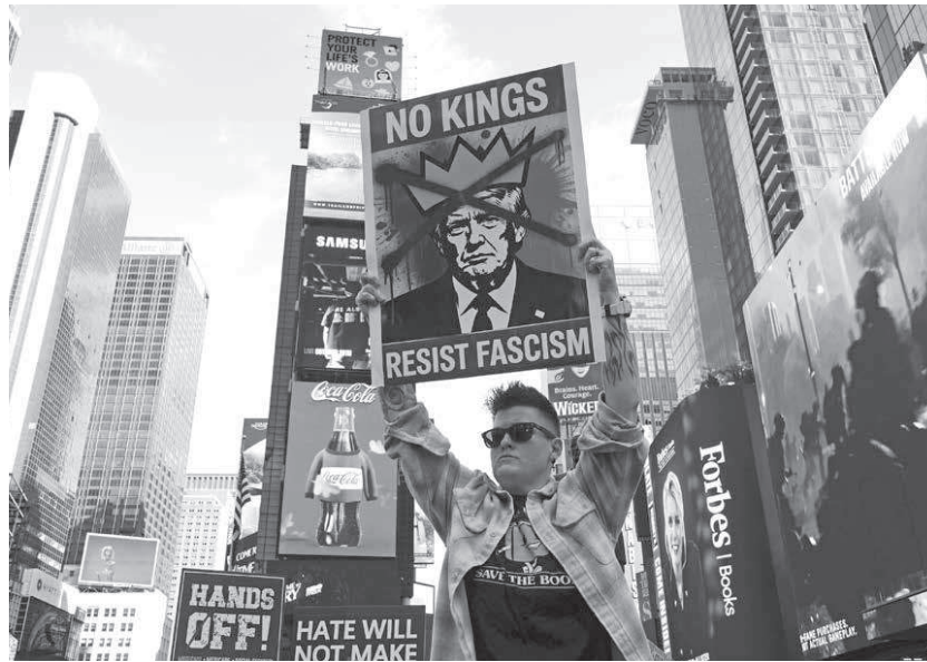
米ニューヨークの観光名所タイムズスクエアで、「王はいらない」と書かれたプラカードを掲げるデモ参加者=10月18日