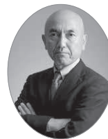
共同通信特別編集委員 半沢隆実

はんざわ・たかみ 1962年福島県会津若松市生まれ。88年共同通信入社。社会部、外信部、カイロ支局特派員、ロサンゼルス支局長、シアトル支局長、ロンドン支局長、ワシントン支局長を経て、2023年6月から共同通信特別編集委員兼論説委員。主な著書に『銃に恋して 武装するアメリカ市民』（集英社）『ノーベル賞の舞台裏』（筑摩書房、共著）など。