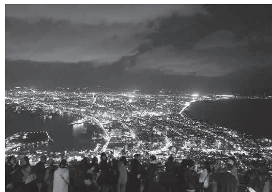
函館の夜景＝10月

も会社でも競争が激しく、常に評価に追われ、あれこれと悩みは増えている。スマホの中の「今日の仕事は食べられるものを見つければ」というシンプルな目標に懸命な世界は、彼らにとって、逆にまぶしく映るのである。また、泥だらけで疲れ果てた人間の姿は、AIが生み出す整った映像とは違い、妙な説得力を持つ。「他人の必死さを見ると、自分の悩みが少し軽くなる」という感想も多い。現実に向かい合っているのか逃避しているのか、判断が難しいが、心が疲れているのは、ひしひしと伝わってくる。 「本を置いて旅に出よ」とある文豪が言った。彼が現代を見たなら、「スマホを置いて、よく寝なよ」と言うかもしれない。