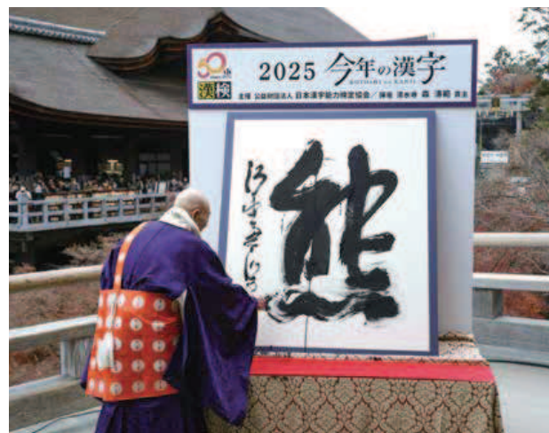
京都・清水寺で発表された、2025年の世相を1字で表す今年の漢字「熊」=12月12日